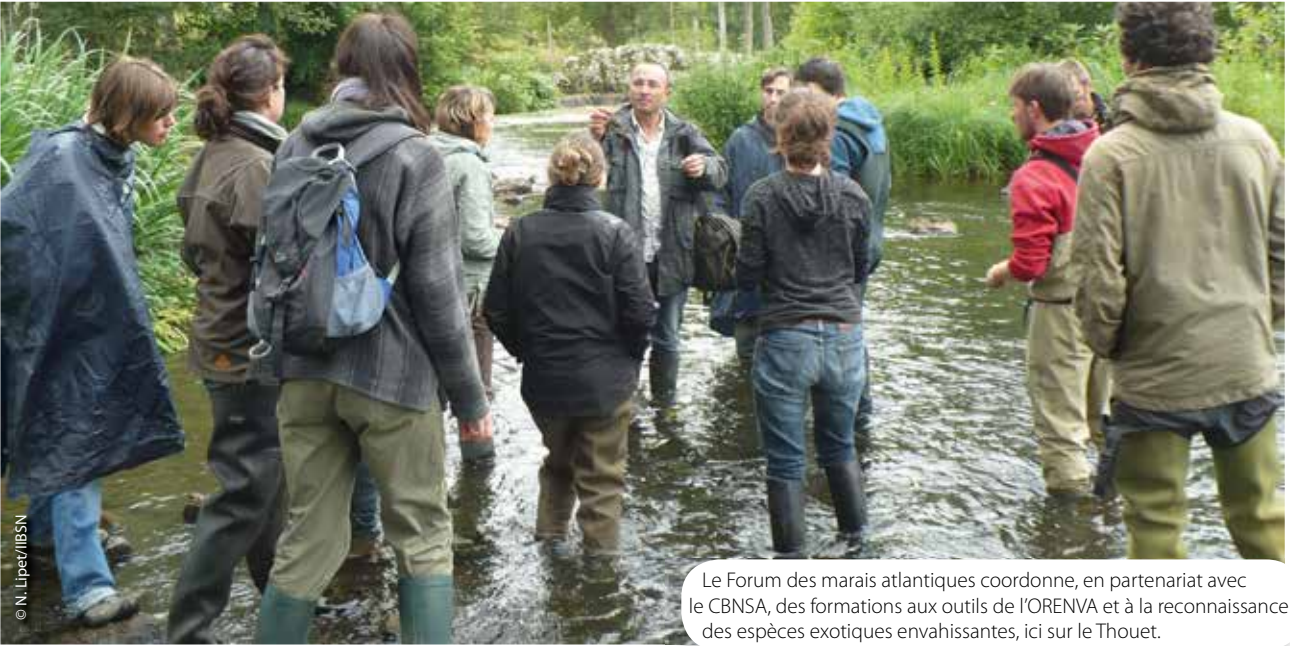
Le Forum des marais atlantiques coordonne, en partenariat avec le CBNSA, des formations aux outils de l'ORENVA et à la reconnaissance des espèces exotiques envahissantes, ici sur le Thouet.

Un comité technique – auquel chaque membre du comité de pilotage peut participer – se réunit également régulièrement pour régler les questions techniques liées à l'élaboration et au fonctionnement de l'ORENVA.