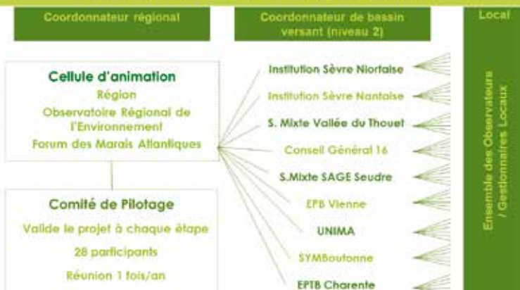
Organigramme de l'ORENVA figurant les trois premiers niveaux d'acteurs, auxquels s'ajoute une coordination interrégionale.