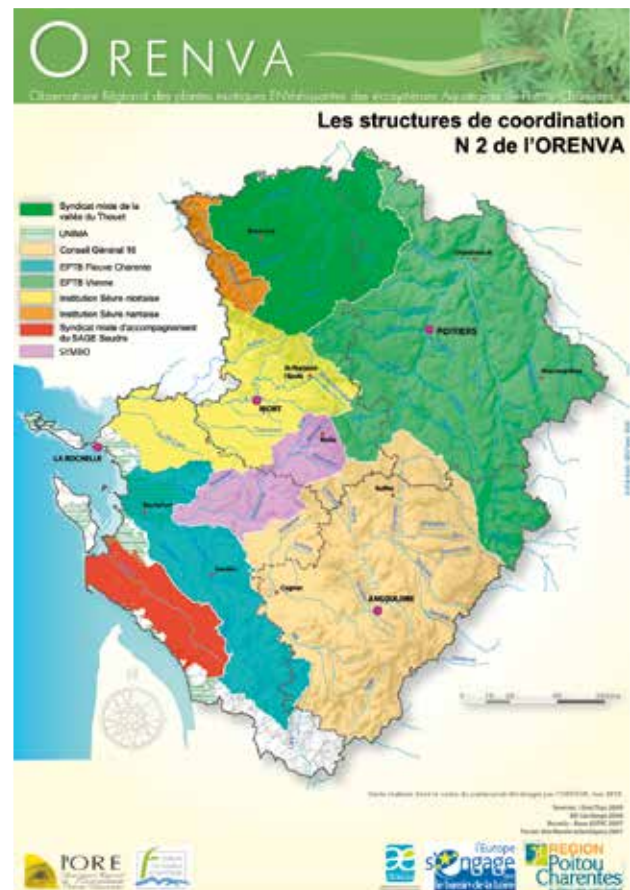
Neuf coordinateurs de bassin couvrent la totalité du territoire régional.