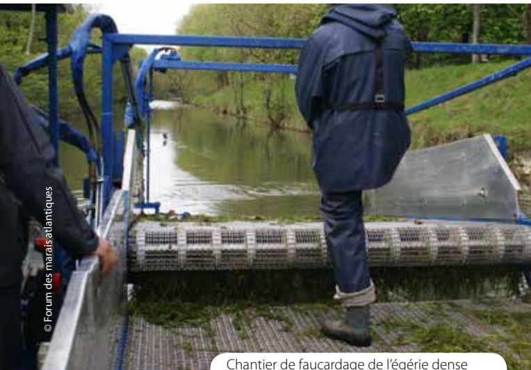
Chantier de faucardage de l'égérie dense dans le canal de Marans à La Rochelle.