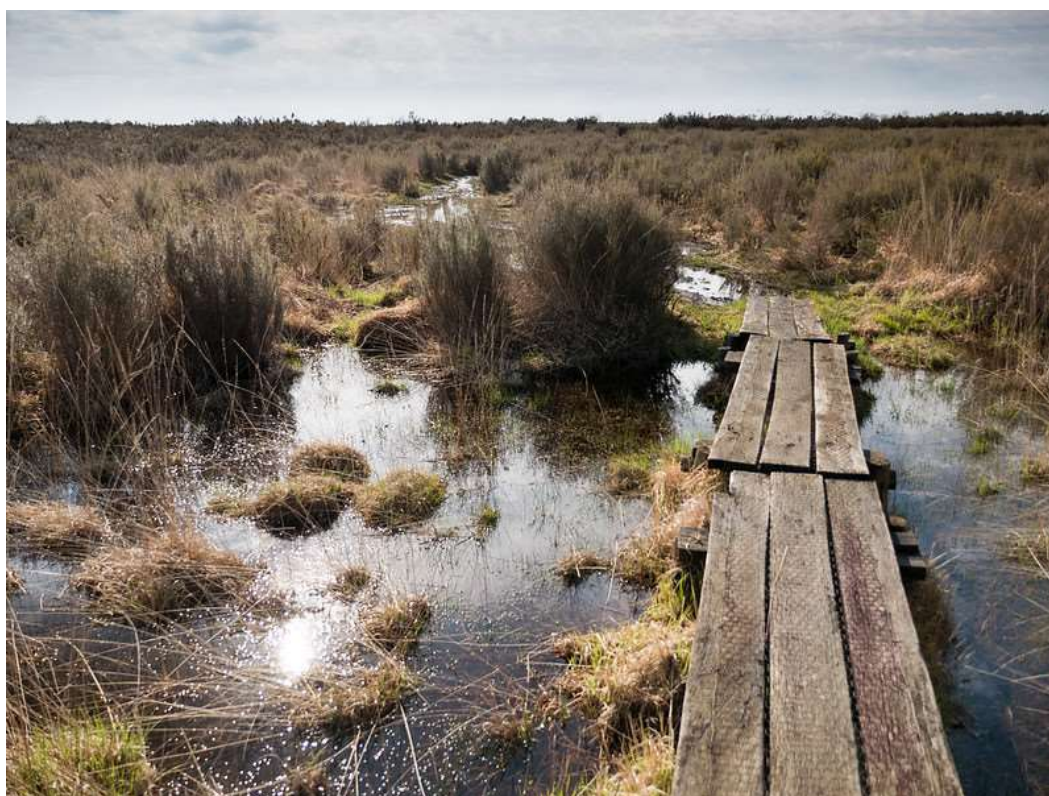
La réserve naturelle nationale du Pinail en 2016.

Marqué par un étonnant et singulier maillage de plus de 7 500 mares permanentes et temporaires qui trouvent leur origine anthropique dans l'extraction de la pierre meulière du IX e au XIX e siècle, le plateau du Pinail offre un complexe humide original de mares, tourbières et roselières, landes sèches et prairies humides, boisements de feuillus et résineux qui s'étend sur 923 hectares en Poitou, entre les rivières de la Vienne et du Clain, dans le département de la Vienne.