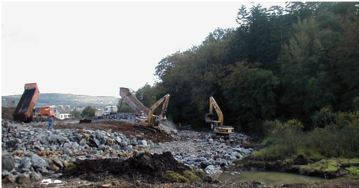
Les zones humides représentent un bien commun fragile. Dans le cadre de projets d'aménagement, comme les projets routiers, la démarche ERC se résume souvent à de la simple compensation.