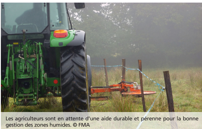
Les agriculteurs sont en attente d'une aide durable et pérenne pour la bonne gestion des zones humides.