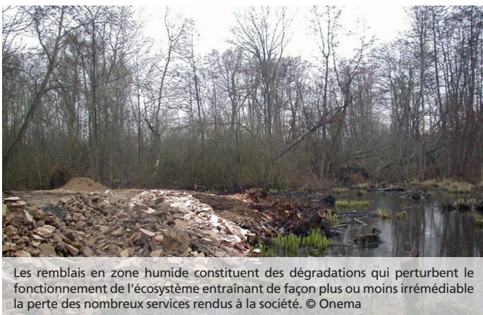
Les remblais en zone humide constituent des dégradations qui perturbent le fonctionnement de l'écosystème entraînant de façon plus ou moins irréversible la perte des nombreux services rendus à la société.