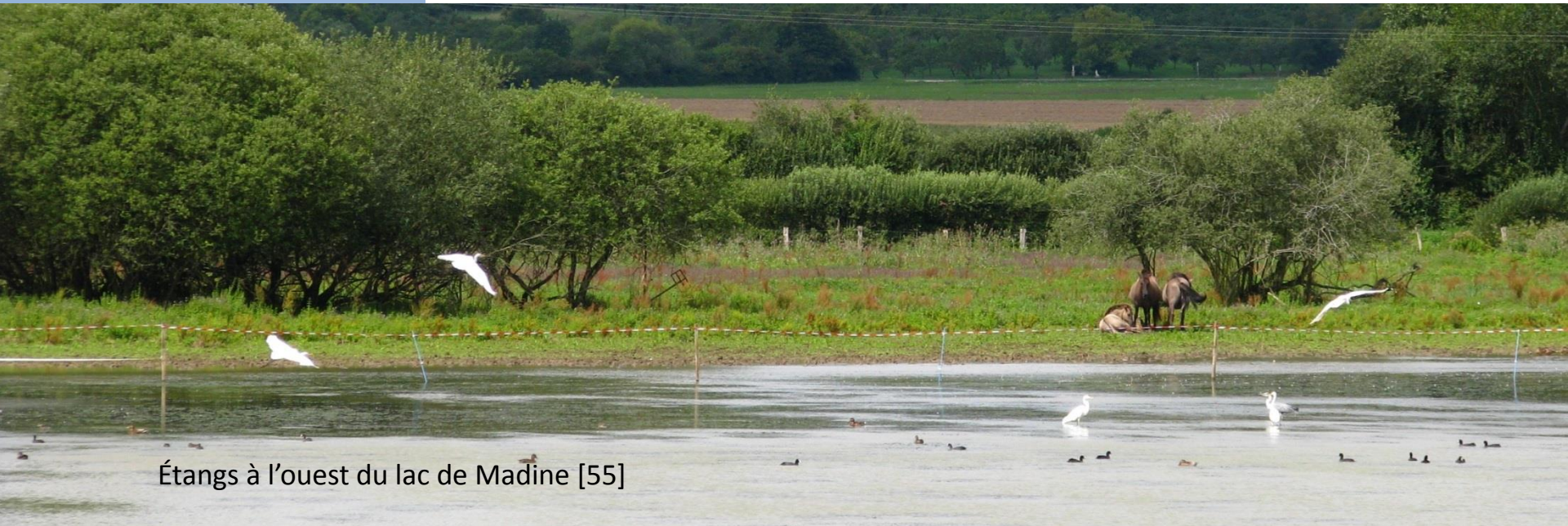
Étangs à l'ouest du lac de Madine [55]