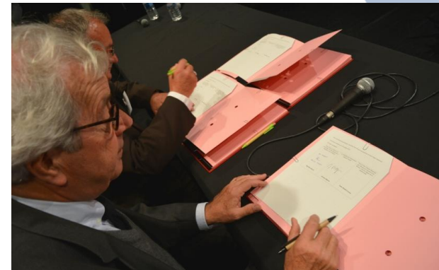
Site Ramsar Marais du Cotentin et du Bessin