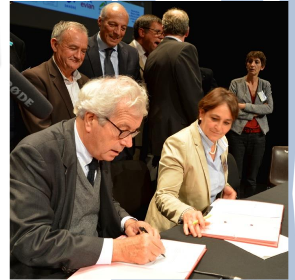
Site Ramsar Baie de Somme