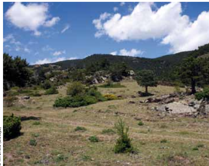
La réserve naturelle de Jujol, dans les Pyrénées-Orientales, a été acquise dans le cadre de la politique des ENS