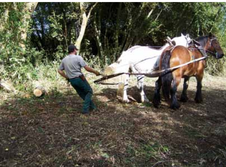
Débardage à cheval

L'ENS de la Prée d'Amont à Vaas (12 hectares), constitué de prairies humides, de roselières et de boisements de saules et frênes, a fait l'objet d'un plan de restauration. Le premier objectif était de limiter l'envahissement des prairies et des roselières par les arbres, afin de favoriser les espèces végétales et animales ayant besoin d'espaces dégagés. Dans un second temps, les travaux ont permis de réhabiliter une zone en réalisant un étrépage (décapage du sol sur une profondeur de 10 cm avec évacuation) sur laquelle le roseau était en train de concurrencer une plante protégée : la Grande Douve. Ces travaux ont été effectués par une entreprise utilisant le cheval de trait. Cette solution est idéale afin de ne pas détériorer le sol parfois impraticable mécaniquement. Les arbres ont été abattus, puis extraits à l'aide des chevaux vers un point de stockage.