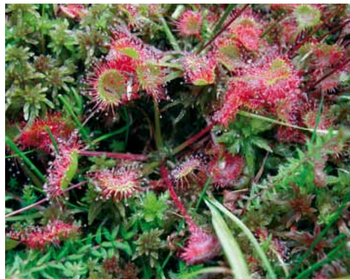
Rossolis à feuilles rondes