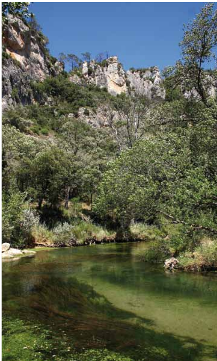
L'ENS du Vallon Sourn (Var), chevauche également un site Natura 2000 : le val d'Argens