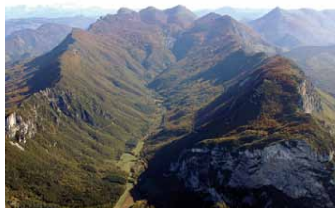
Forêt de Saoû