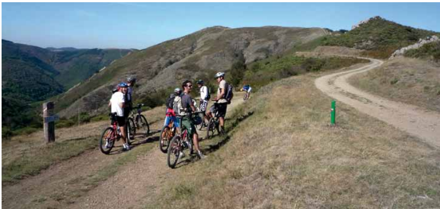
VTTistes sur le réseau vert héraultais

Le Réseau Vert® mis en place par le département de l'Hérault fait partie du Plan départemental des itinéraires de promenade et de randonnée (PDIPR). Il est par ailleurs labellisé « Grande Traversée de l'Hérault » (GT 34) par la Fédération française de Cyclisme. Il s'agit d'un linéaire de 520 kilomètres offert aux piétons, VTTistes et cavaliers, reliant notamment des propriétés départementales acquises au titre de la politique des espaces naturels sensibles. Cet itinéraire arrive dans le département du Gard à l'est et dans les départements du Tarn et de l'Aude à l'ouest. Par ailleurs, cette découverte des paysages héraultais est facilitée par la mise en place par le département d'un hébergement constitué à ce jour de 7 « Relais du Réseau Vert », situés sur cet itinéraire et dont la fréquentation est en augmentation constante depuis leur création. Ceux-ci permettent à tout amateur de nature de faire halte pour une ou plusieurs nuits sur des bâtiments propriétés du département ou loués par lui pour cet usage.