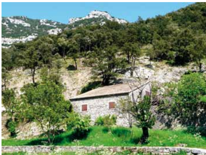
Ancienne bergerie réhabilitée en maison du patrimoine, sentier d'interprétation d'accès libre et classé en réserve naturelle volontaire par le CG en 1986.

Le massif de Saoû (2 450 hectares) est un des sites naturels les plus remarquables de la Drôme, de par sa diversité floristique et faunistique ainsi que sa rareté géologique. Ce site, classé depuis 1942 au titre du patrimoine naturel et paysager, est de longue date un lieu très prisé pour la balade, la randonnée, l'escalade, le vélo ou la découverte de l'environnement. Depuis son rachat en 2003 par le département de la Drôme au titre de la politique ENS, les activités de tourisme et de loisirs sont gérées et organisées au quotidien grâce à une « Charte d'utilisation partagée et de développement durable », adoptée par les acteurs représentant les différents usagers de la forêt. Elle permet une utilisation raisonnable et concertée de la forêt de Saoû dans le respect de l'environnement ainsi que des attentes et besoins de tous.