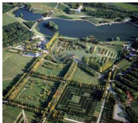
Parc de Sausset

meilleure appropriation des enjeux liés à la préservation de la biodiversité à travers ses actions de médiation et son centre de ressources. Il édite différents documents comme « le biodiversitaire » qui est un bilan annuel des travaux et études menés autour de la biodiversité en Seine-Saint-Denis, mais également d'une lettre d'information (accessible sur inscription). Il gère, par ailleurs, un fonds documentaire comprenant des ouvrages et des fiches outils sur la biodiversité du département, afin de favoriser une meilleure intégration des objectifs environnementaux par les acteurs du territoire.