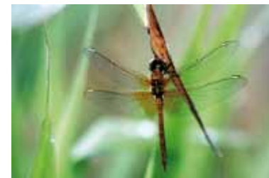
Sympetrum jaune d'or

Afin de gérer au mieux son patrimoine naturel, le département de Seine-Saint-Denis a créé en 2005 l'Observatoire départemental de la biodiversité urbaine (ODBU). Cet observatoire s'est donné pour priorité de faciliter pour tous l'accès à la connaissance en matière de biodiversité urbaine. L'observatoire vise à créer les conditions d'une