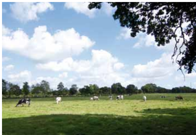
Marais du Mesnil

Le marais du Mesnil-au-Val (250 hectares), situé à proximité de l'agglomération cherbourgeoise, est composé de bois, de landes et de prairies humides para-tourbeuses. Les difficultés d'utilisation du sol en découlant ont entraîné une forte déprise agricole sur les secteurs les plus humides, provoquant un reboisement naturel de surfaces importantes depuis les années 1970. Afin d'inverser cette tendance, le conseil général a confié à la chambre d'agriculture de la Manche et un écologue indépendant la mission de réaliser un diagnostic de l'activité agricole du site et de ses proches abords. Cette étude a permis d'aboutir à la rédaction de cahiers des charges adaptés aux types d'exploitations environnantes et déclinés en fonction de la valeur patrimoniale des habitats naturels et de leur sensibilité. Pour mener cette action le conseil général, au titre de sa politique ENS, a acquis 16 hectares de terrain. Par ailleurs, sur les parcelles à forte valeur patrimoniale, le pâturage biennuel avec un chargement moyen a été préféré à un pâturage annuel très extensif.