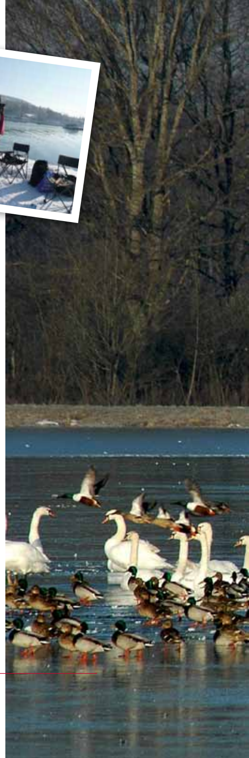
Ci-dessus : observation et dénombrement d'oiseaux et ci-contre : anatidés sur un étang gelé dans la Dombes