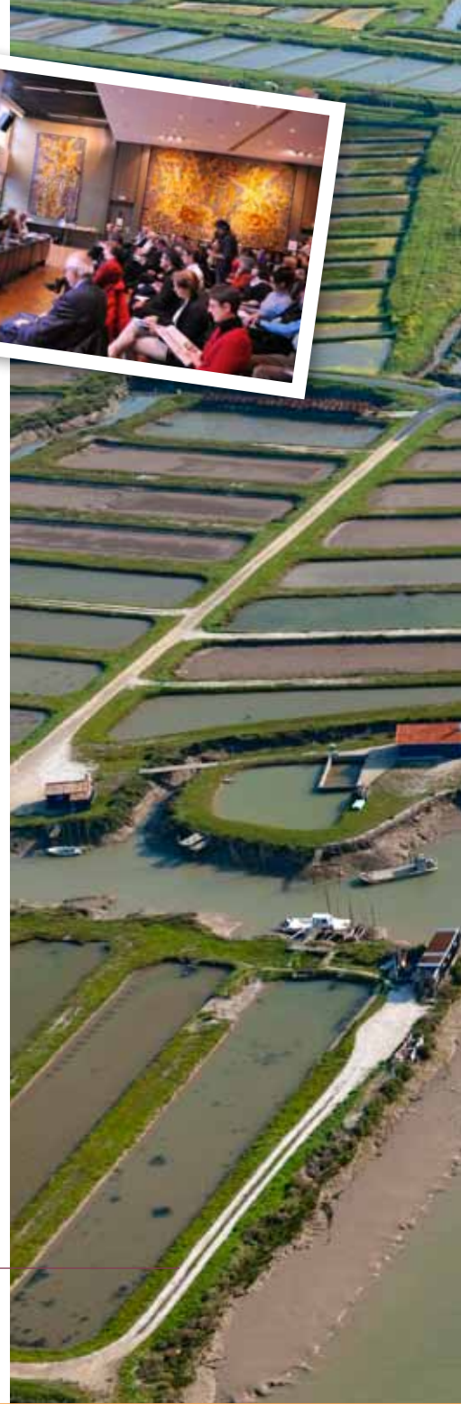
Ci-dessus : réunion d'un groupe de travail et ci-contre : chenal dans l'estuaire de la Sèvre