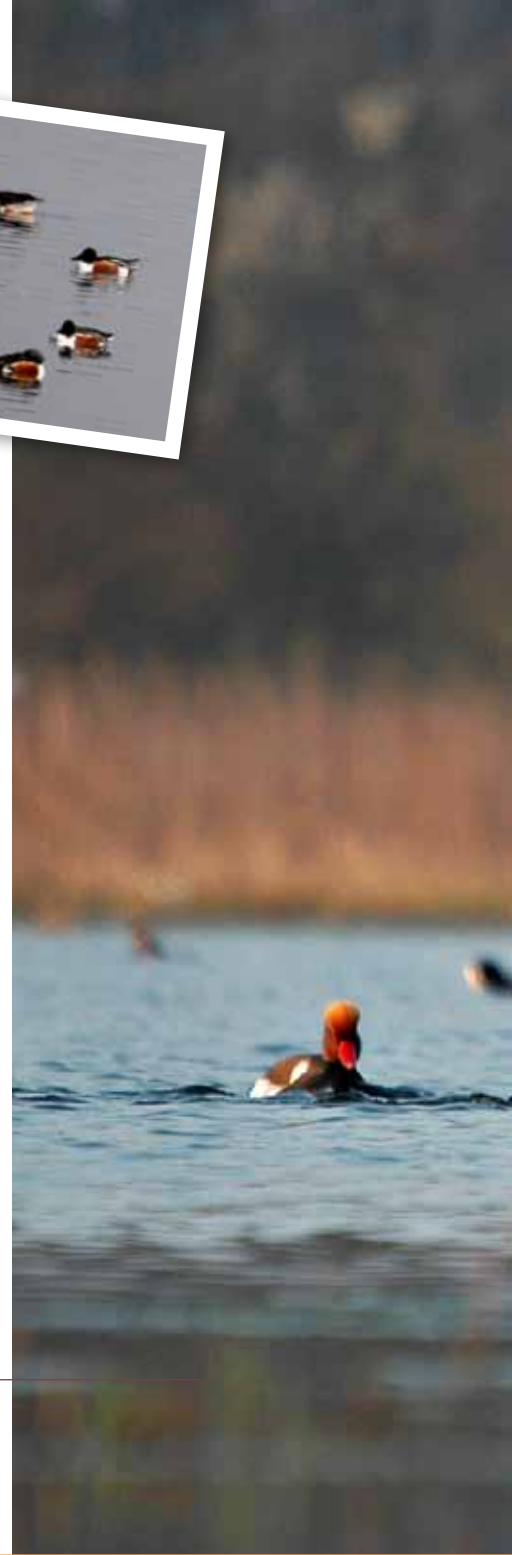
Ci-dessus : canards souchets (Anas clypeata) et oie au second plan et ci-contre : nettes rousses (Netta rufina)