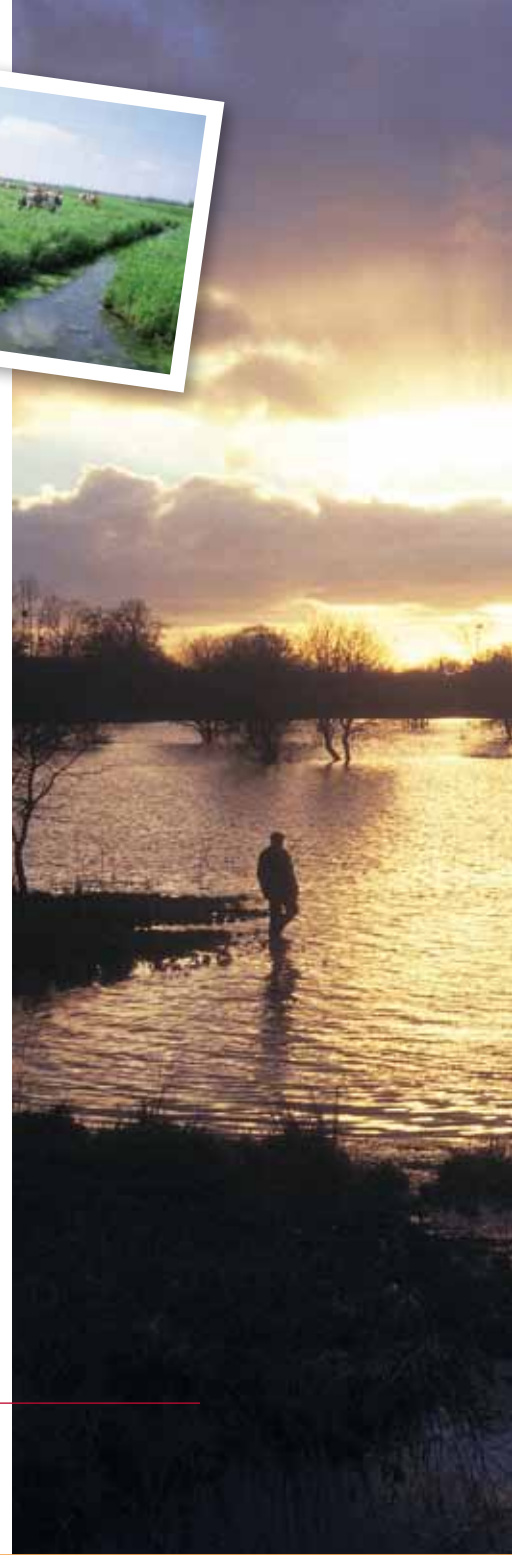
Ci-dessus et ci-contre : parc naturel régional des marais du Cotentin et du Bessin