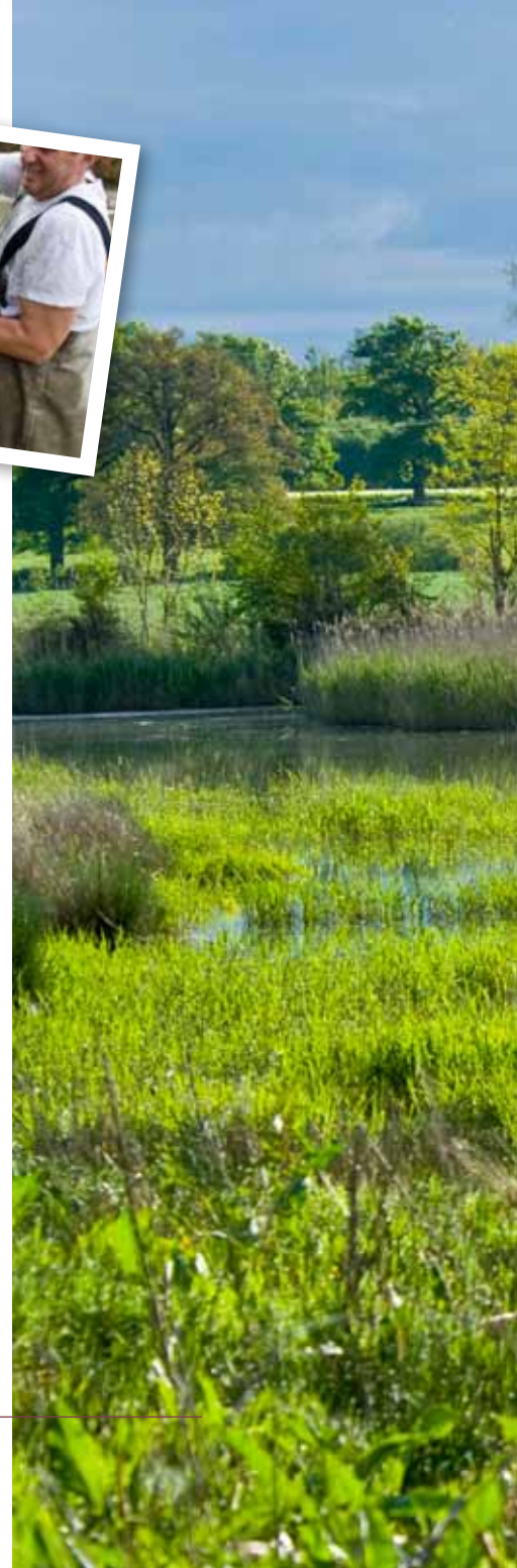
Ci-dessus : pêche d'étang dans la Dombes et ci-contre : étang Victor à Rignieux-le-Franc