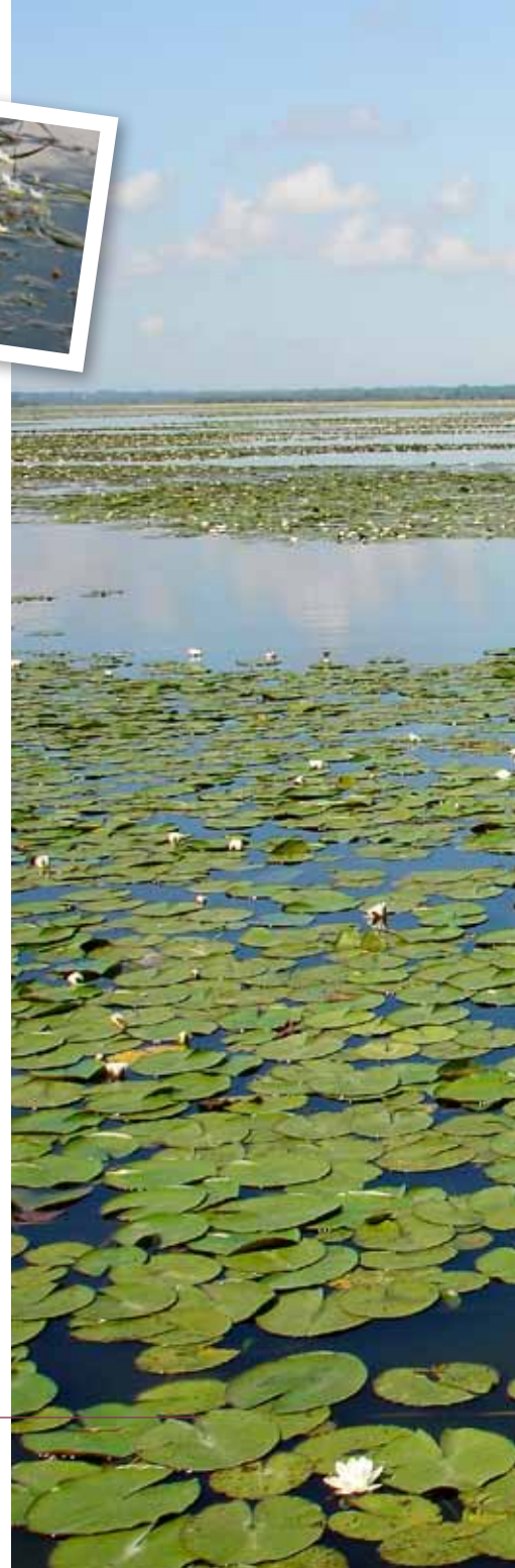
Ci-dessus : renoncules des rivières et ci-contre : macrophytes sur le lac de Grand-Lieu