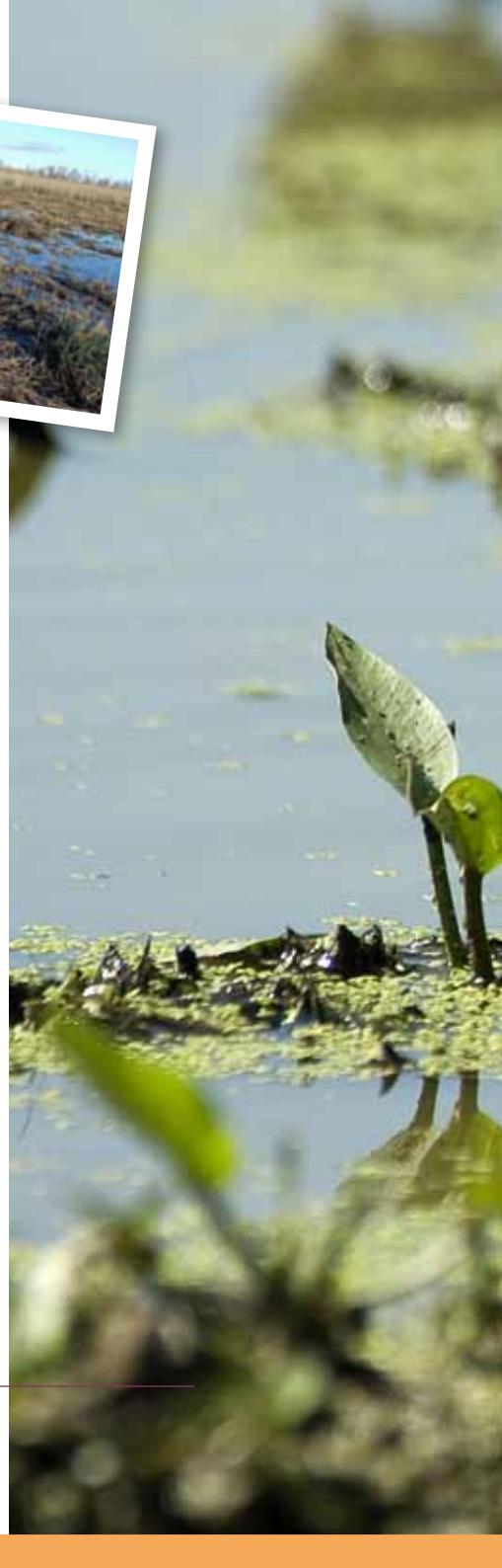
Ci-dessus : platière aménagée et ci-contre : bécassine des marais (Gallinago gallinago)