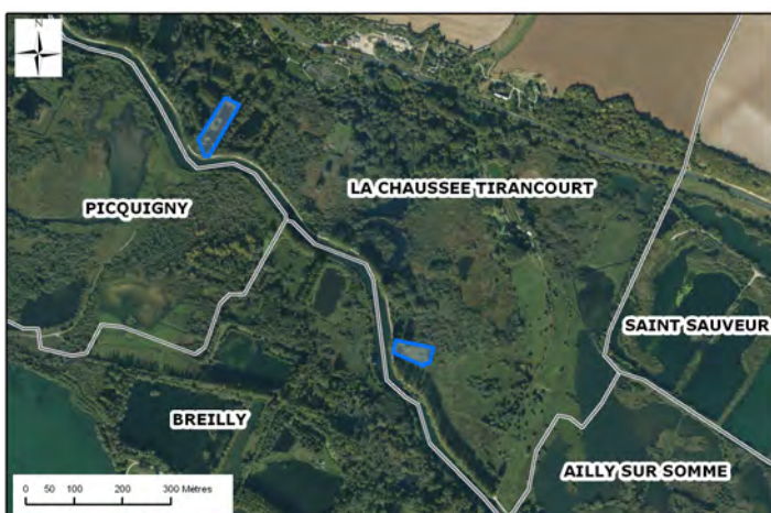
IGN BD ORTHO®, BD CARTO®, A.E.A.P.