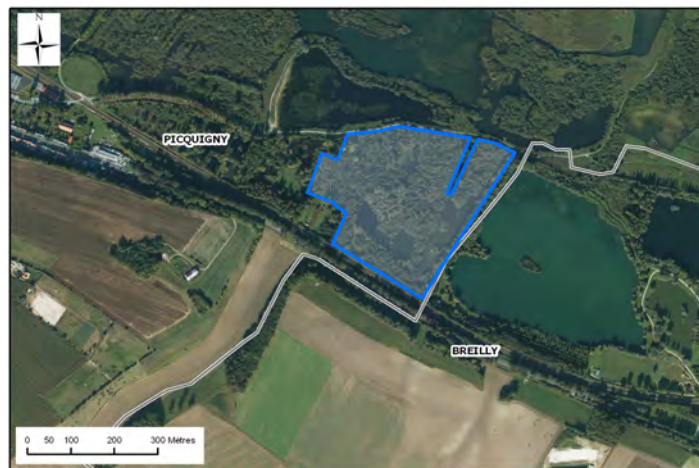
IGN BD ORTHO®, BD CARTO®, A.E.A.P.