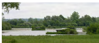
Étangs de Mareuil-Caubert