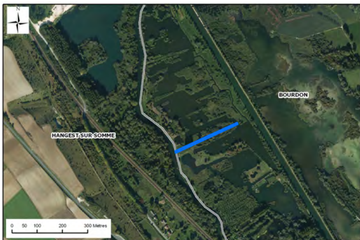
IGN BD ORTHO®, BD CARTO®, A.E.A.P.