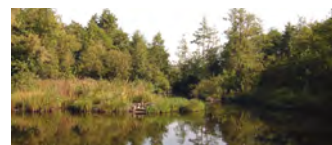
Marais des Prés de la mare