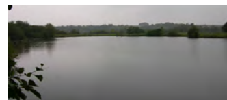
Étangs de Mareuil-Caubert