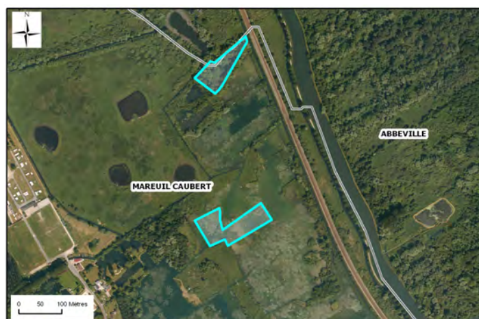
IGN BD ORTHO®, BD CARTO®, A.E.A.P.