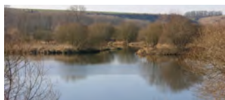
Marais des Cavins