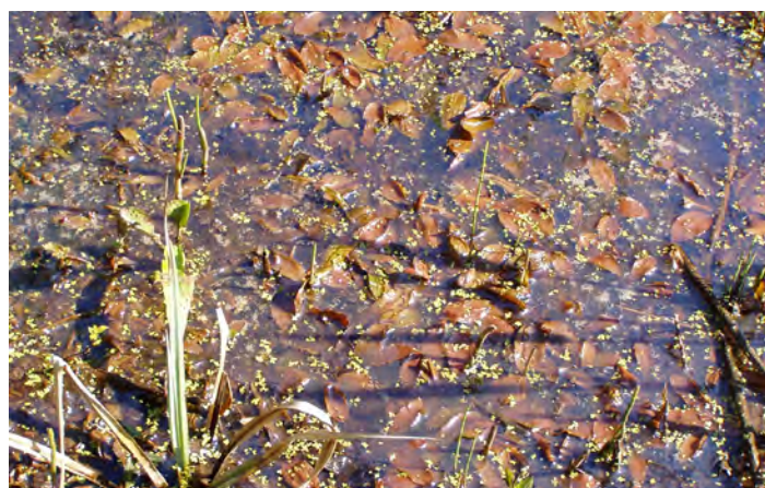
Potamot coloré ( Potamogeton coloratus )

Enfin, les pratiques habituelles de création de layons* et de platières* ont permis d'ouvrir le milieu et d'obtenir des végétations basses favorables au maintien d'espèces patrimoniales.