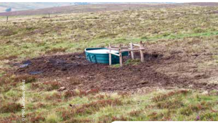
Zone humide dégradée par le piétinement lors de l'abreuvement du bétail.