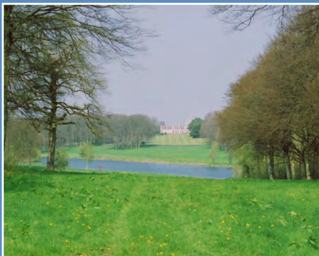
Domaine de Régnière-Écluse

Afin de soustraire ce domaine d'un risque important de parcellisation et de démembrement, le CELRL* en assure la maîtrise foncière.