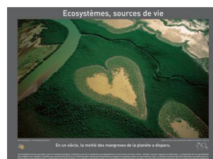
- L'eau, élément de vie