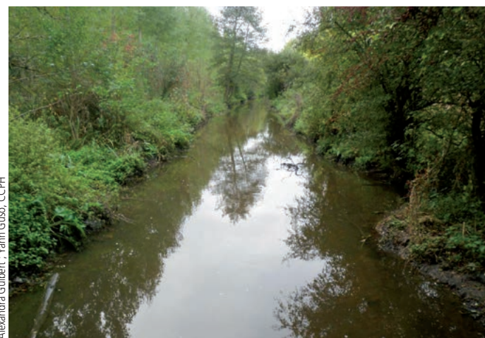
La Vesgre sur le secteur restauré en amont, avant travaux en 2011.

trat par les matières fines, uniformisation des écoulements. Les habitats sont ainsi peu diversifiés et la capacité d'accueil de la faune aquatique est réduite. Le substrat ne se constitue plus que d'une couche vaseuse de plusieurs dizaines de centimètres. Certaines espèces animales à