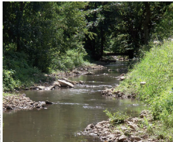
Mathias Alloux, CCPH

L'action a des impacts positifs sur le cours d'eau qui retrouve des écoulements diversifiés et des substrats à granulométrie variée. Sur le secteur amont, le resserrement du lit par la mise en place de banquettes favorise une diversité des écoulements empêchant ainsi le colmatage du substrat par les matières fines. L'amélioration de l'hydromorphologie se traduit par des vitesses, un faciès d'écoulement (radier, plat courant, fosse) et une oxygénation proches de l'état naturel pour ce type de cours d'eau. Ces observations sont plus nuancées sur la partie aval, la réduction de section étant légèrement insuffisante ; du colmatage en période de basses eaux est observé.