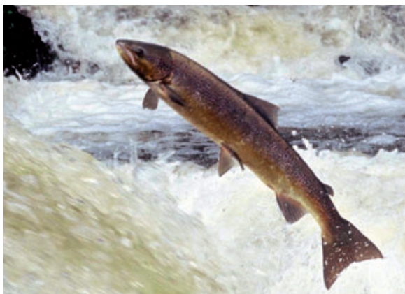
Saumon atlantique tentant de franchir le seuil du Moulin de Ver. Automne 2009