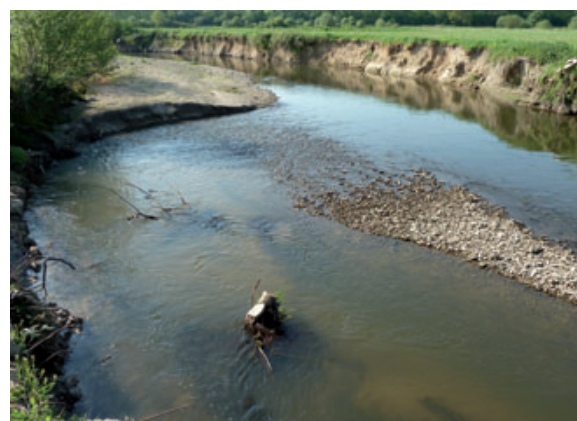
Remobilisation des sédiments dans l'ancienne retenue après effacement de l'ouvrage. Avril 2011

La disparition de la retenue d'eau fait réapparaître une diversité de faciès courants. Ainsi, sept radiers sont retrouvés, en alternance avec des rapides et des faciès plus lenticules. Le retour des radiers offre une surface de 2 400 m 2 désormais disponible à la fraie des espèces piscicoles. Suite à l'effacement de l'ouvrage, 13 frayères à lamproie marine ont été identifiées dans l'emprise de l'ancienne retenue.