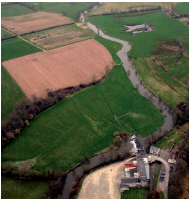
Vue sur la vallée de la Sienne avec le seuil du Moulin de Ver en premier plan. Avril 2006