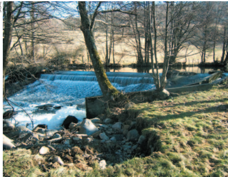
Point de vue sur le seuil avant (à droite) et après arasement (ci-dessous, en novembre 2009). Le site est en partie revégétalisé, le lit mineur est diversifié.