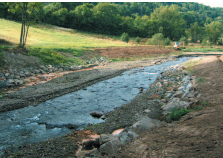
L'arasement du seuil de Stalapos en juin 2008, durant la phase de travaux. Le cours d'eau est dévié pour permettre la mise à sec du seuil et de la retenue.