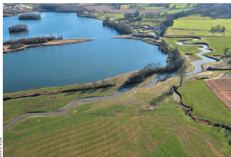
Deux vues aériennes du nouveau tracé de la Veyle en périphérie de la gravière toujours en activité (janvier 2010).