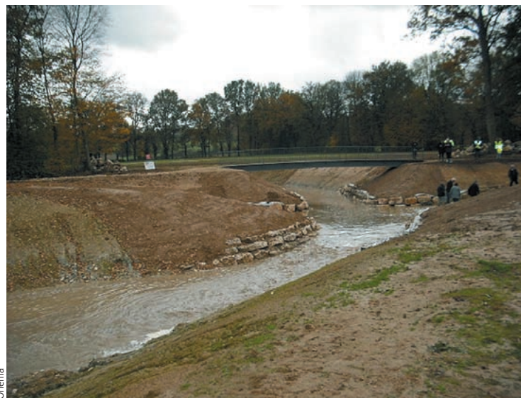
La mise en eau du nouveau lit de la Veyle en novembre 2009

L'existence d'une démarche active du contrat de rivière et la motivation des élus du syndicat mixte Veyle vivante ont été un atout pour l'aboutissement de cette opération qui a malgré tout mis une dizaine d'années à se concrétiser.