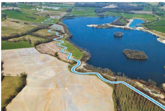
Localisation des parcelles acquises [rose] pour la réalisation du projet de dérivation de la Veyle au droit de la gravière de Saint-Denis-lès-Bourg et tracé de l'ancien [rouge] et du nouveau [bleu] lit du cours d'eau.