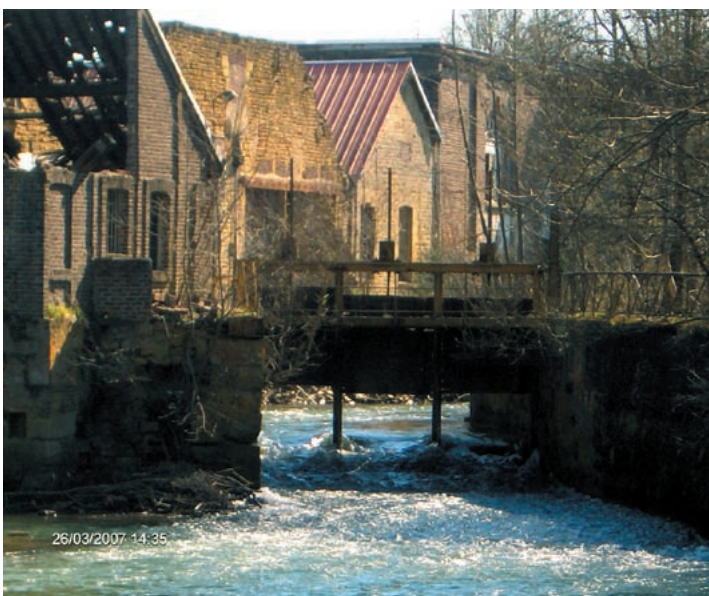
Le vannage de Saint-Marceau en mars 2007, trois ans après son ouverture.