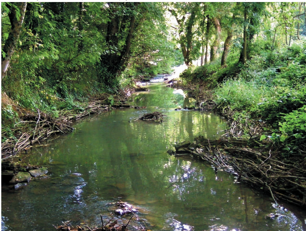
Gregory Stéphan - SIETAV

L'amont du vannage de Poix-Terron en septembre 2009. Des peignes et des déflecteurs latéraux et centraux sont mis en place pour diversifier les écoulements.