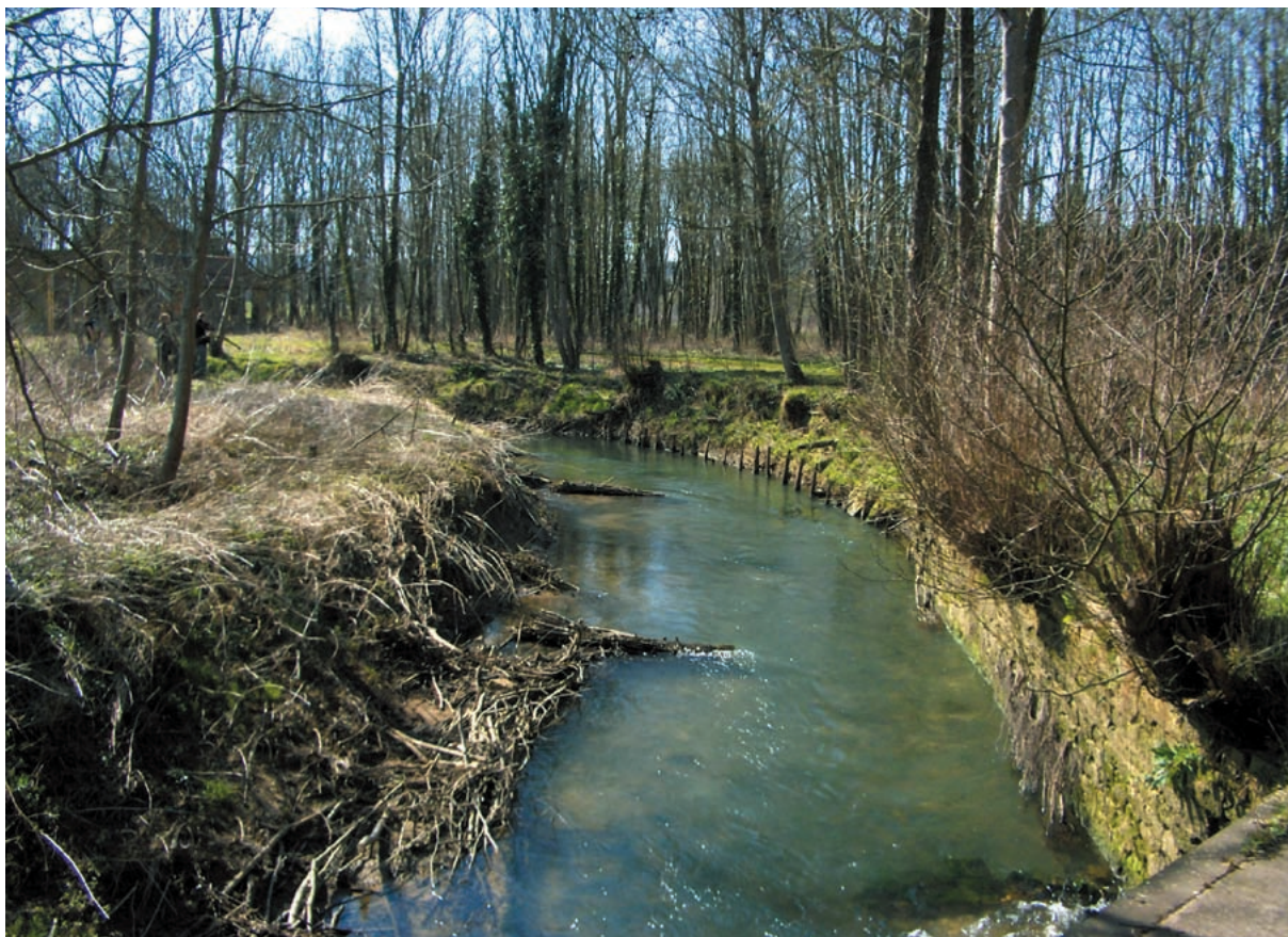
Josée Peress - Onema

L'amont du vannage de Saint-Ponce en mars 2007, après son ouverture. Des épis rustiques sont mis en place en rive droite pour rediversifier les écoulements.