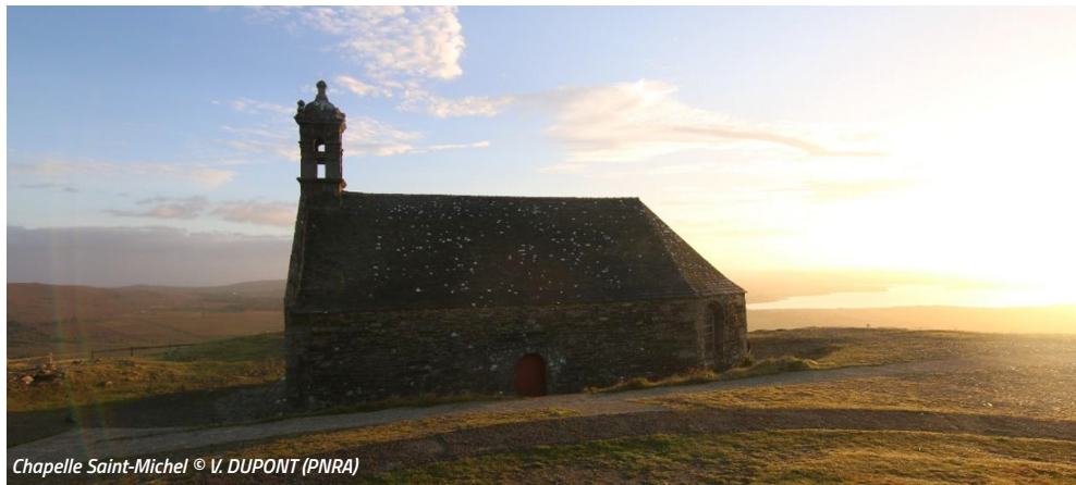
Chapelle Saint-Michel

Avec la participation du PNRA (Harmonie COROLLER, chargée de mission Natura 2000), du Conservatoire botanique national de Brest (Vincent COLASSE) et du FMA (Armelle DAUSSE, coordinatrice du réseau sur la restauration des zones humides de Bretagne)