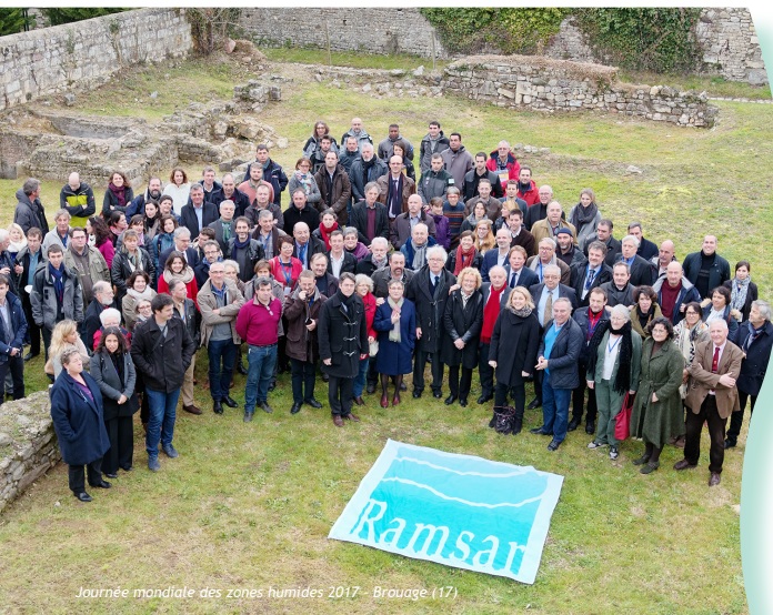
Journée mondiale des zones humides 2017 - Brouage (17)

L'association Ramsar France a été créée en 2011 par les gestionnaires de sites Ramsar, pour créer un lien entre les réflexions et résolutions des pays signataires de la Convention de Ramsar, et les sites français désignés.