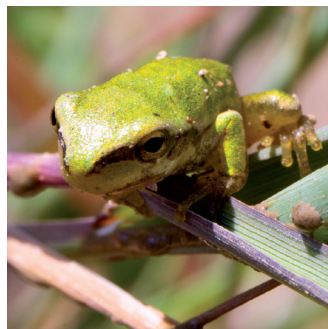
RAINETTE SARDE ( Hyla sarda )

Grande demoiselle observable à partir de mai, Lestes macrostigma se distingue aisément par ses couleurs vert et bleu cuivrées. Rare et menacée, elle exige des zones humides de bonne qualité pour se développer. Elle est également reconnue comme un bon indicateur du changement climatique et fait partie à ce titre des dix-huit taxons du Plan national d'actions « Odonates ».