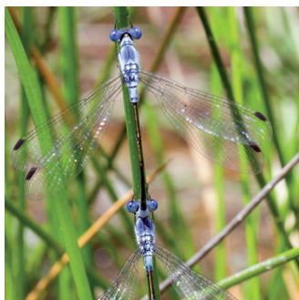
LESTE À GRANDS STIGMAS ( Lestes macrostigma )

La découverte de Pilularia minuta sur les Tre Padule de Suartone, une première pour la Corse, est à l'origine de la reconnaissance de la haute valeur floristique du site. Minuscule plante amphibie des mares temporaires, caractérisée par son rhizome traçant et ses feuilles filiformes, elle est classée comme espèce en danger d'extinction (EN) sur les listes rouges mondiale et européenne de l'IUCN.