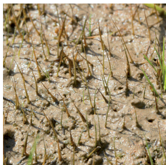
PILULAIRE DÉLICATE ( Pilularia minuta )

La découverte de Pilularia minuta sur les Tre Padule de Suartone, une première pour la Corse, est à l'origine de la reconnaissance de la haute valeur floristique du site. Minuscule plante amphibie des mares temporaires, caractérisée par son rhizome traçant et ses feuilles filiformes, elle est classée comme espèce en danger d'extinction (EN) sur les listes rouges mondiale et européenne de l'IUCN.