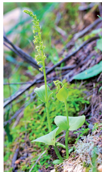
GENNARIE À DEUX FEUILLES ( Gennaria diphylla )

Endémique de Corse et de Sardaigne, cet anouë à la peau lisse et verte trouve dans les quatre mares des Tre Padule de Suartone un site propice à sa reproduction, notamment par l'absence de poissons. Équipée de ventouses adhésives, la rainette passe la majeure partie de son existence à terre, se nourrissant d'insectes dans les buissons et hibernant sous une mousse ou dans le creux d'un rocher.