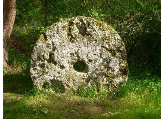
Visite du site Ramsar du Pinail