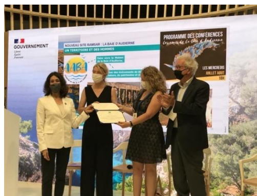
Baie d'Audierne et remise du diplôme Ramsar lors du congrès mondial de la nature