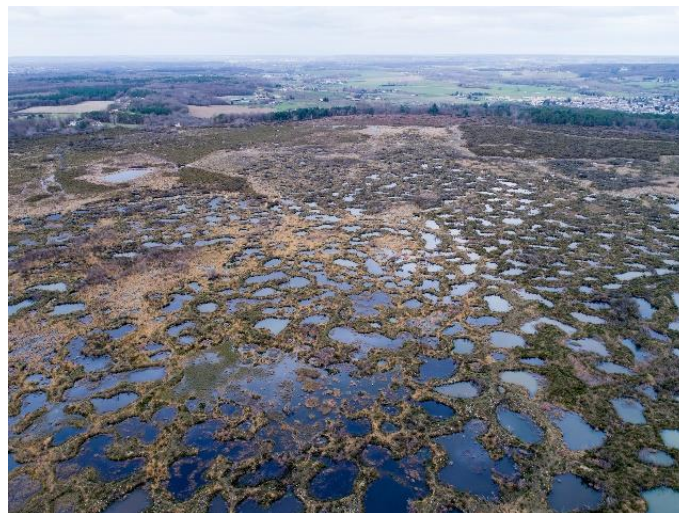
Vue aérienne du Pinail