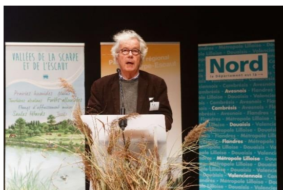
13 ème séminaire Ramsar, Valenciennes