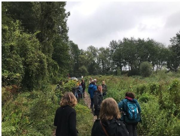
Rencontre du réseau Ramsar Hauts-de-France dans les marais de Sacy