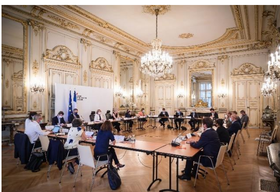
Echange en amont du congrès mondial de la nature au Ministère de la Transition Ecologique