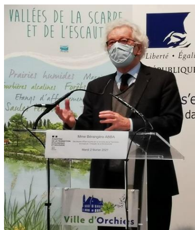
Remise du diplôme Ramsar aux élus du site, le 2 février 2021