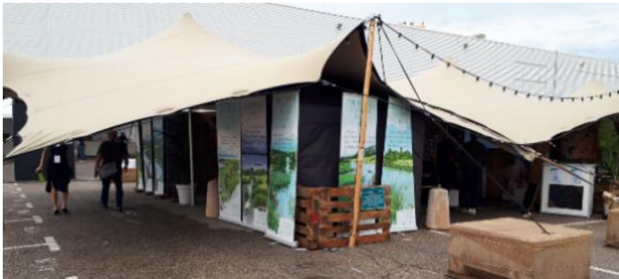
Village des zones humides