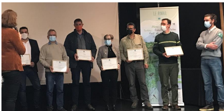
Remise du diplôme aux acteurs du site Ramsar du Pinail