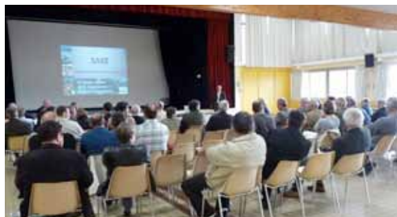
Présentation des principaux enjeux du territoire d'un SAGE

doivent être compatibles avec les objectifs de protection des zones humides prévus dans les SDAGE et les SAGE. Les espaces les plus remarquables du littoral, définis par la loi « Littoral » - notamment dunes, landes côtières, plages, lidos, estrans, falaises, forêts et zones boisées proches des rivages, îlots inhabités, etc. - ont vocation à être classés, autant que faire se peut, en zones inconstructibles. Il en est de même pour les abords des grands lacs en montagne, auxquels s'appliquent la loi Littoral et la loi Montagne.