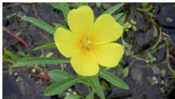
Fleur de jussieu

L'UICN estime que, jusqu'ici, 1 200 espèces de plantes ont été introduites aux Antilles, 1 700 en Polynésie française, et 2 000 à la Réunion. En outre, 49 espèces figurant parmi les 100 plus envahissantes au monde sont présentes en outre-mer. C'est l'une des premières causes d'érosion de la biodiversité dans ces territoires (« L'outre-mer confronté au défi des espèces exotiques envahissantes », Comité français de l'UICN, 2008)