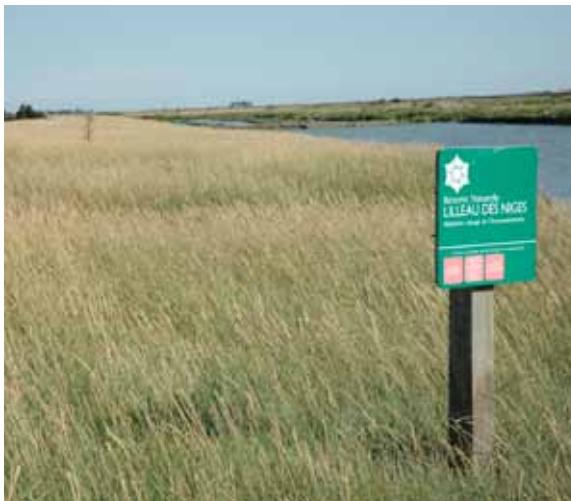
Signalétique de la réserve naturelle nationale de Lilleau des Niges

La protection des espèces - animales comme végétales - des milieux humides et de leurs habitats naturels se fonde notamment sur la loi de 1976 relative à la protection de la nature (art. 411-1 et 411-2 du code de l'environnement). Cette loi est à l'origine des listes d'espèces protégées, sur lesquelles s'appuie la Stratégie nationale pour la biodiversité (SNB), adoptée en 2004 et relancée en 2012. Tout déplacement ou destruction... d'espèces protégées est soumis à demande de dérogation auprès des services de l'Etat (Direction régionale de l'environnement, de l'aménagement et du logement). Une liste d'espèces de gibier dont la chasse est autorisée a été fixée pour la métropole, ainsi que pour certains départements et territoires d'outre-mer. L'introduction d'espèces exotiques est également réglementée sur le territoire français par différents arrêtés.