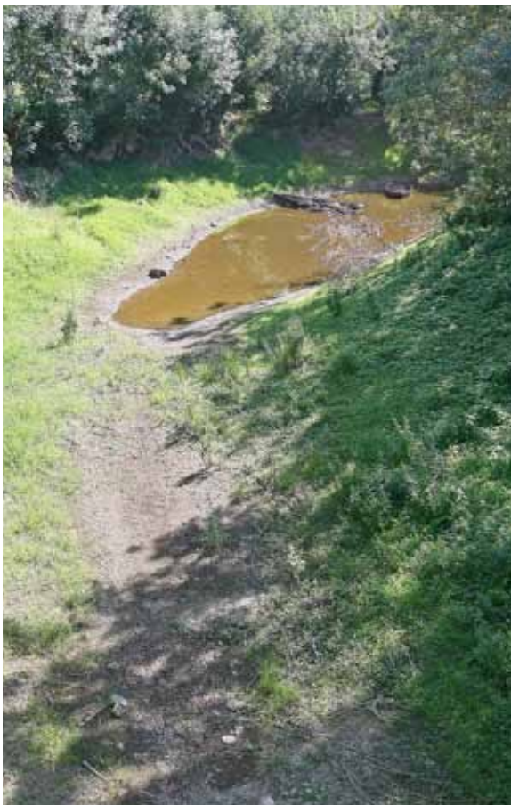
Cours d'eau assec au cœur du marais poitevin

La biodiversité diminue également, les espèces voyant leur habitat se réduire et se morceler. Certaines espèces disparaissent en raison de l'introduction des espèces exotiques envahissantes entrant en compétition avec ces dernières. La disparition des prés salés, des mangroves et des herbiers marins entraîne la raréfaction des zones de refuge et de reproduction pour de nombreuses espèces terrestres et marines. Ces phénomènes ont des conséquences multiples - appauvrissement de l'environnement, diminution des stocks de poissons, etc. -, car la biodiversité sous-tend les nombreux services écosystémiques que fournissent les milieux humides.