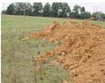
Olivier Leroyer - Onema

Enquête sur la représentation sociale des zones humides - Synthèse - MEDDE 2012