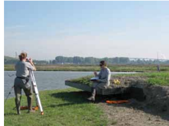
Mission de Police - Contrôle de l'emprise des mares de chasse dans l'estuaire de Seine

Pour plus d'informations sur la délimitation des zones humides pour la réglementation, voir la fiche « La diversité des milieux humides ».