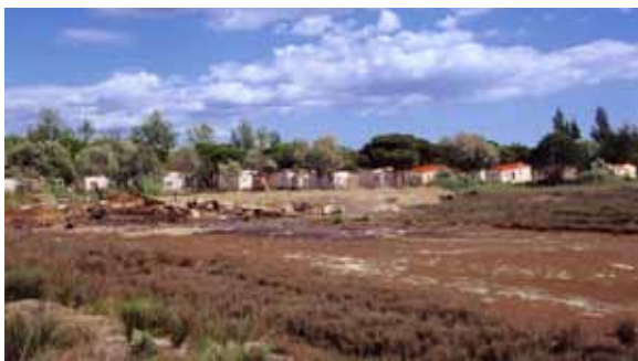
Extension sans autorisation d'emplacements de campings sur le marais méditerranéen adjacent

Les espèces des milieux humides sont également menacées par les espèces exotiques envahissantes, animales ou végétales. Selon l'UICN (Union internationale pour la conservation de la nature), les invasions biologiques sont, après la destruction des habitats,