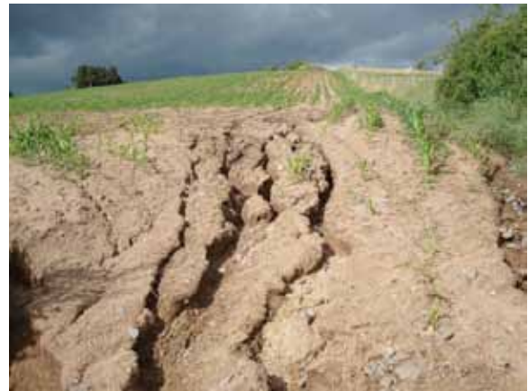
Erosion des sols

Des évaluations du coût de remplacement ont été menées dans la moyenne vallée de l'Oise. Pour limiter l'impact des crues, le prix d'un barrage-