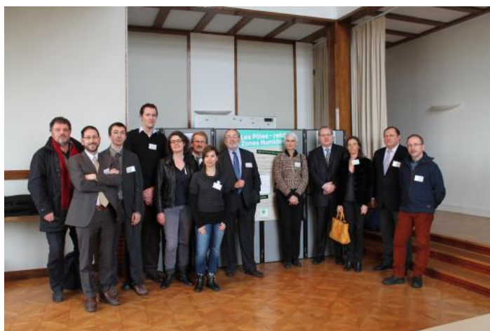
Extrait de la charte des Pôles-relais zones humides

Créés en 2001 dans la lignée du plan national en faveur des zones humides pour accompagner les initiatives locales en faveur de la gestion durable des zones humides, les Pôles-relais travaillent sur l'ensemble des thèmes zones humides : tourbières, lagunes méditerranéennes, marais Atlantiques Manche et mer du Nord, mares, zones humides intérieures et vallées alluviales, Zones Humides d'Outre-mer (nouveau 2012). Leurs actions sont coordonnées au niveau national par l'Onema .